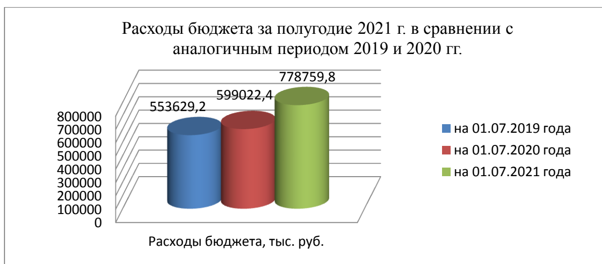
Рис. 3. Исполнение расходов бюджета за полугодие 2021 года в сравнении с аналогичным периодом 2019 и 2020 гг., тыс. руб.

Исполнение расходов бюджета за полугодие 2021 года в сравнении с аналогичным периодом 2019-2020 гг. представлено на рис. 3.